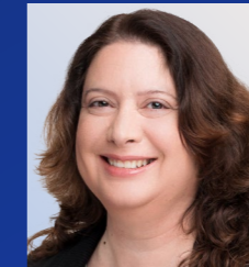
יפעת שעה שותפה, מיסוי ישראלי